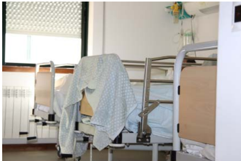
Um dos quartos ocupados por homens. A maioria dos doentes são do sexo masculino.