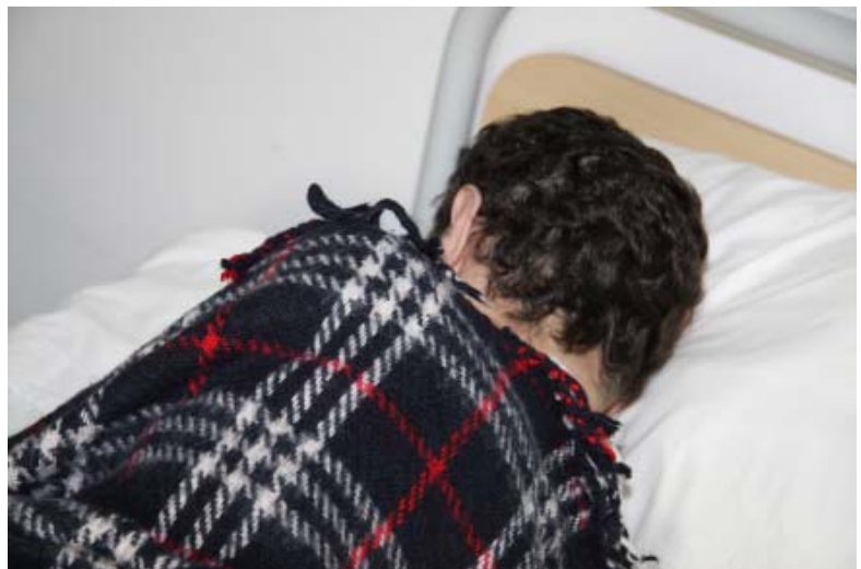
D. Licínia (nome fictício), na sua cama, na Unidade de cuidados continuados, no Farol. Foto autorizada por ela.