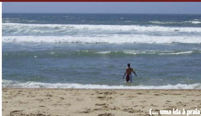
(... uma ida à praia)

É certamente um trabalho com dificuldades e limitações às vezes quase extremas. Mas, apesar disso, e contra isso, a Cáritas de Coimbra está objectivamente a melhorar a qualidade de vida dos indivíduos infectados pelo VIH/SIDA, quer directamente, favorecendo a adopção de estilos de vida mais saudáveis, quer indirectamente, favorecendo o apoio de redes e serviços sociais.