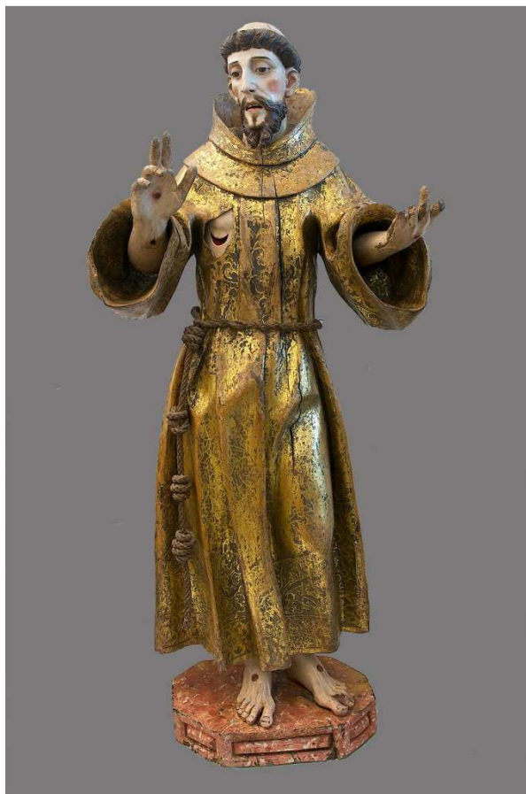
S. Francisco de Assis